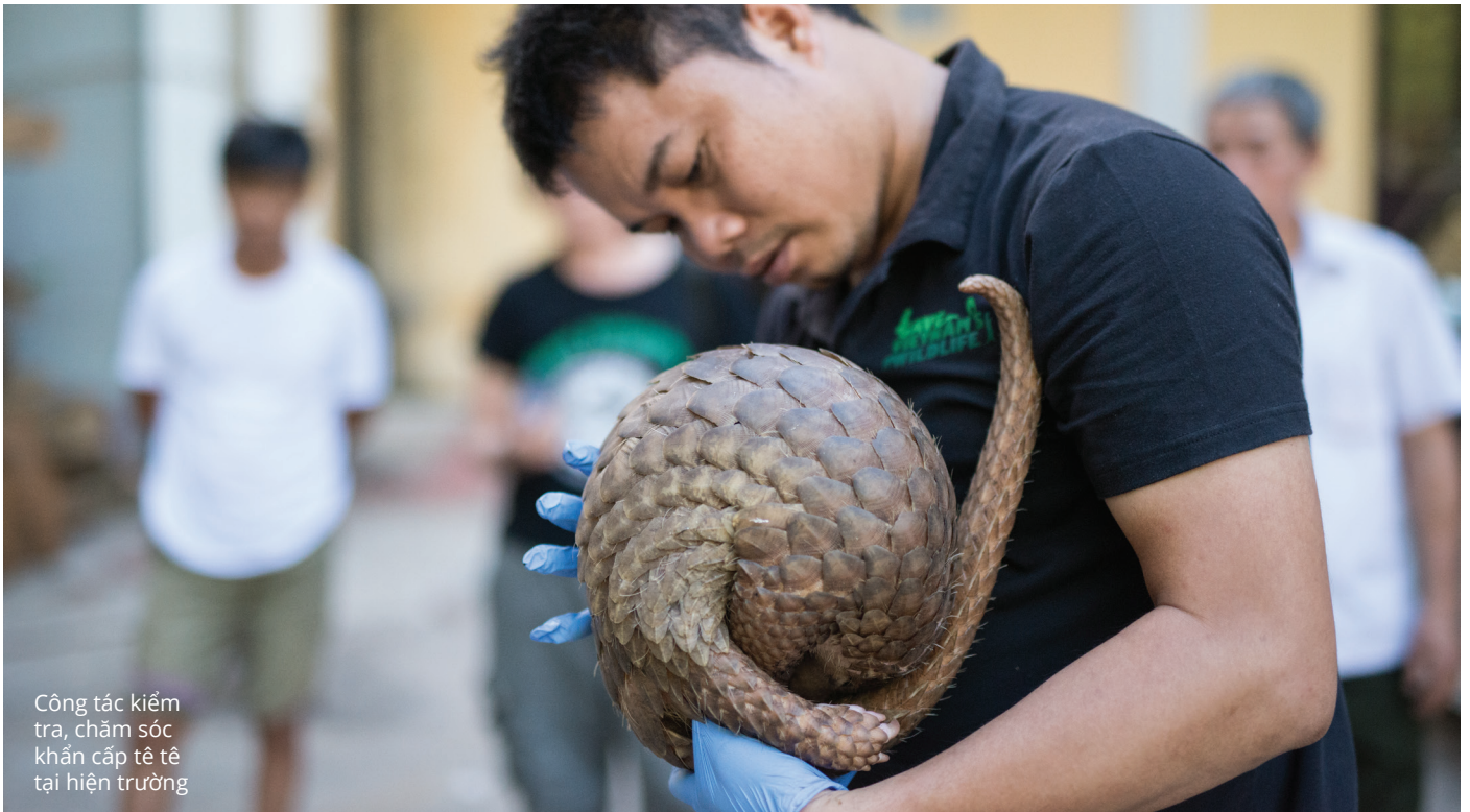
Công tác kiểm tra, chăm sóc khẩn cấp tê tê tại hiện trường

TÌM HIỂU THÔNG TIN QUA TRANG WEB CỦA CHÚNG TÔI: SAVEVIETNAMSWILDLIFE.ORG , CHANGEVN.ORG , WILDAIDVIETNAM.ORG